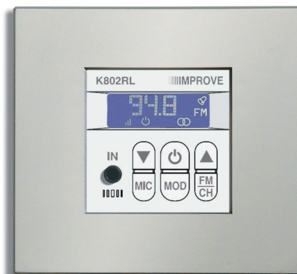
K802RL + marco K861S