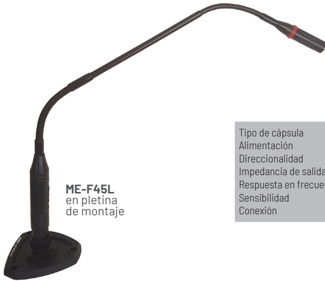
ME-F45L en pletina de montaje