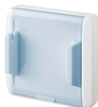
Support and connection