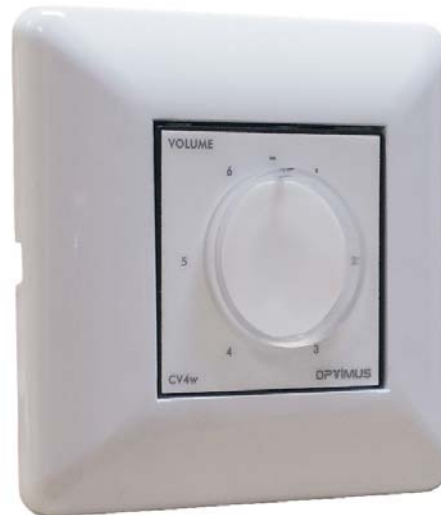
CV-4WE + M-420W

The CV selector supports 6 100-V line inputs and uses a rotating switch to select one of them.