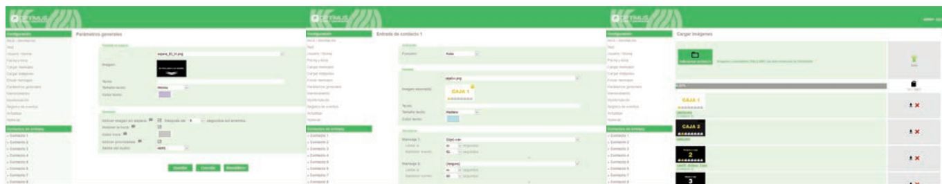
Pantalla de parámetros generales