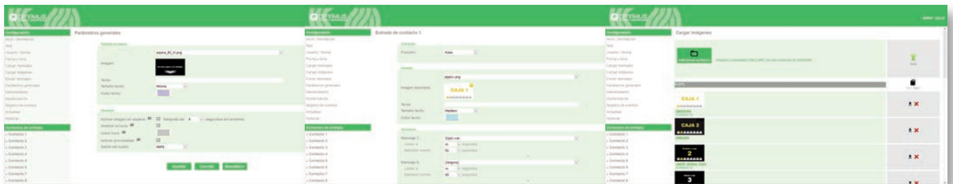
General parameters screen